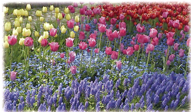
チューリップとムスカリなど植付けられた花壇